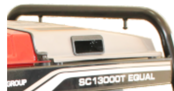
Cadru tratat pentru a preveni ruginirea