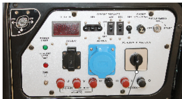
Comutator curent iesire monofazic sau trifazic