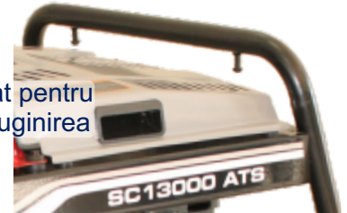
Cadru tratat pentru a preveni ruginirea